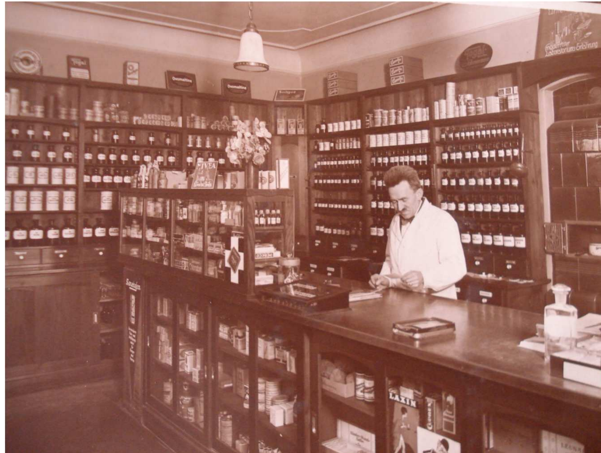
Der Autor Ludwig Brunner (1881–1961)